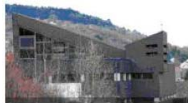
"Communio Sanctorum" neue Kirche m. l. Pfarrzentrum; 1975/76 zwischen Unter- u. Oberleinach gebaut